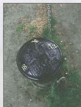
Water, haven en scheepvaart zijn in Gent op talloze plekken (on)opvallend aanwezig.