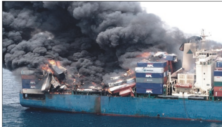
Les Rotterdam Rules modifieraient le régime de responsabilité dans le transport.

Le séminaire, qui aura lieu dans l'après-midi, abordera plusieurs aspects essentiels des Rotterdam