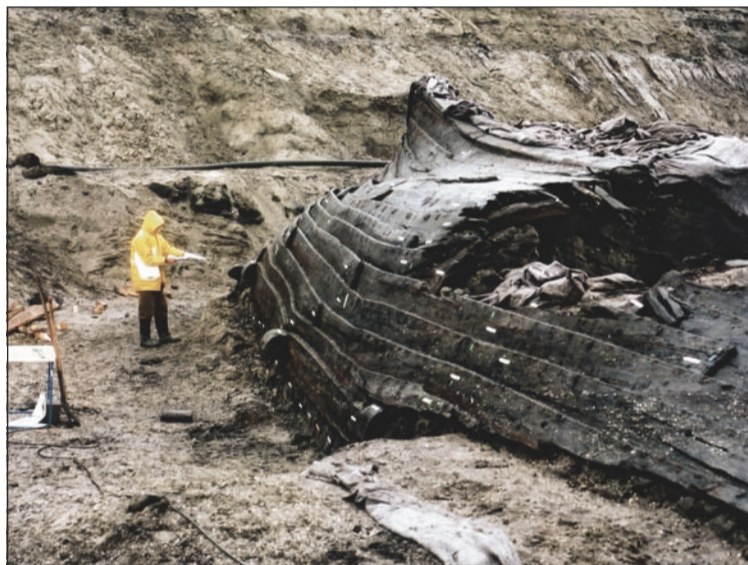
Le Manifeste du patrimoine maritime demande une meilleure protection de sites archéologiques.