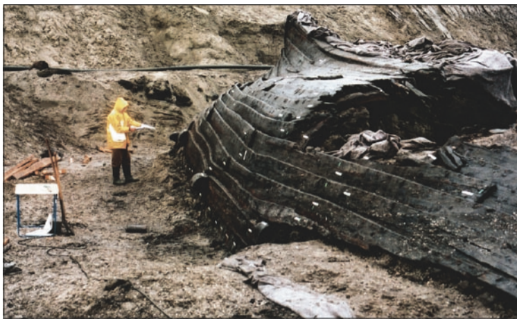
De "Doelse Kogge 1" is het oudste en best bewaarde wrak van een middeleeuws vrachtschip.