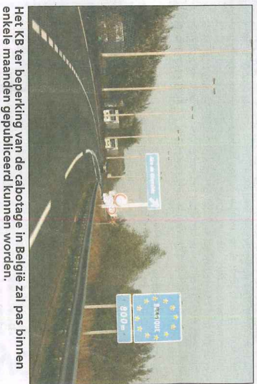
Het KB ter beperking van de cabotage in België zal pas binnen enkele maanden gepubliceerd kunnen worden.

Op Europees niveau zou er deze week in Straatsburg een 'triloog'