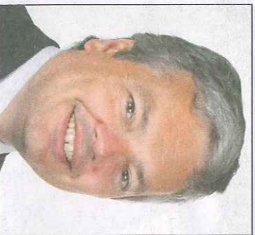
Didier Reynders, minister van Financiën.