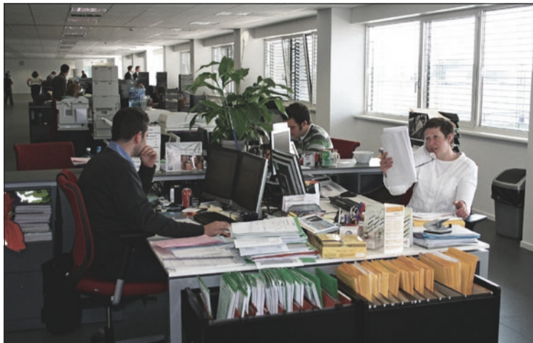
In 2007 steeg het aantal jobs in de sector van de transportorganisatoren met 1.100 voltijdse eenheden.

Uit de studie, die zowel de sociale indicatoren, de toegevoegde waarde als de financiële gezondheid en financiële indicatoren in beeld brengt, blijkt verder dat de groei niet ten koste ging van de financiële gezondheid. Zo zijn de liquiditeit en de solvabiliteit in de referentieperiode verbeterd, hoewel de netto verkoopmarges in het algemeen vrij laag bleven. Dat wijst er volgens het BITO op dat de sector zich aan de vooravond