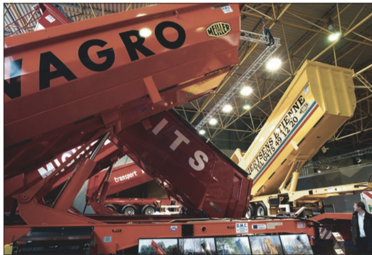
Een recordeditie wordt het ditmaal niet, maar "Trailer 2009" is wel de enige beurs in haar soort die dit jaar stand houdt.