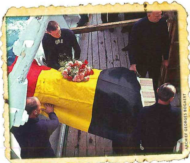
1962. Een dode aan boord wordt in de zee geworpen.