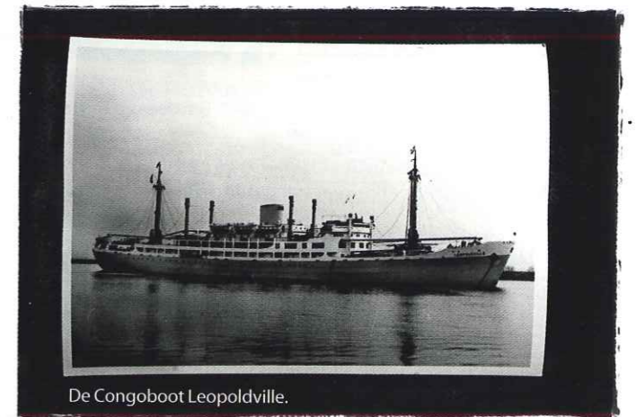
De Congoboot Leopoldville.

— Door Stijn Tormans