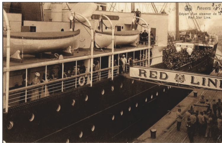
De Red Star Line is één van topprojecten inzake maritiem erfgoed.

De initiatiefnemers willen de overheid en de beleidsmakers een duidelijk signaal geven dat er wel degelijk belangstelling is voor het Antwerpse maritiem erfgoed, zodat ook privébedrijven zouden beseffen dat er zich hier een doel aandient voor sponsoring.